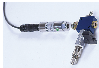
Capteur de pression et bloc désaérateur sont inclus