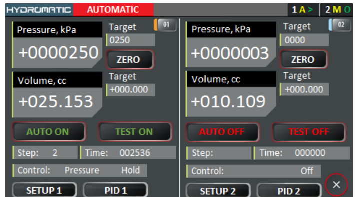
Auto Control (capture d'écran) : Exécution automatique de pas préprogrammés de pression et/ou de changement de volume