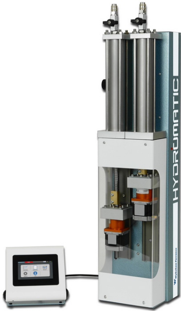
L'Hydromatic pourra être positionné verticalement pour un agencement optimal des composants d'essais