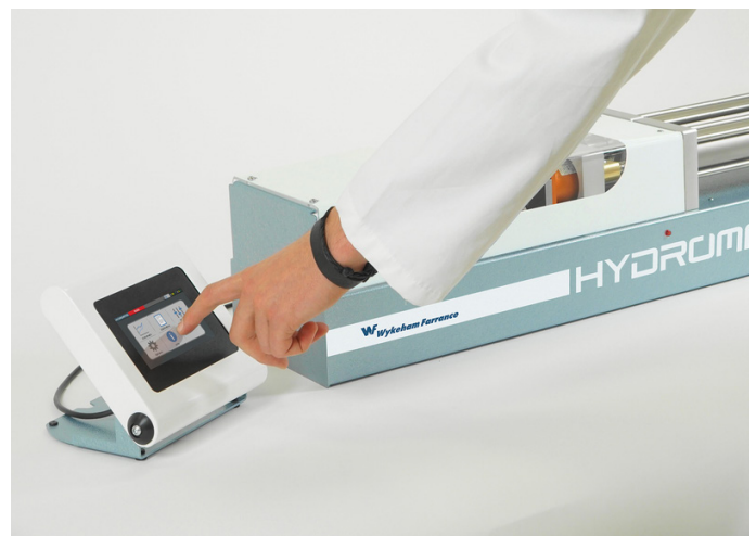
L'unité de contrôle est amovible et pourra être positionnée selon les nécessités ou souhaits de l'utilisateur

Pour un système standard de contrainte effective, un Hydromatic double ligne sera requis - une pour pression cellulaire et une pour contrepression. Une utilisation typique d'un Hydromatic simple ligne sera l'adjonction d'une ligne pour essai de perméabilité de cellules triaxiales sols ou roches. Le(s) capteur(s) de pression et bloc(s) désaérateur(s) sont inclus. Des micro-interrupteurs intégrés évitent toute surcourse.