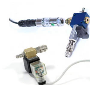
Valvola on/off, trasduttore di pressione e blocchetto disaerante inclusi con l'unità Hydromatic